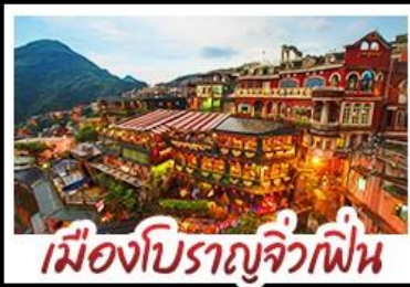
เมืองโบราณจิ่วเฟิ่น