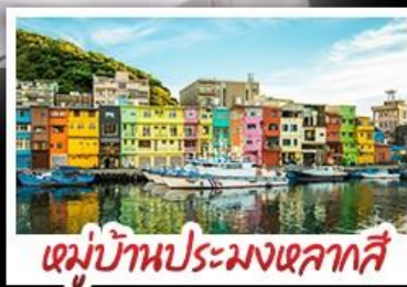
หมู่บ้านประมงเหลากสี