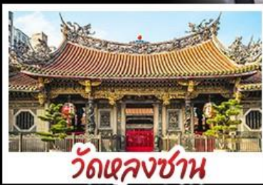
วัดเจหลงชาน