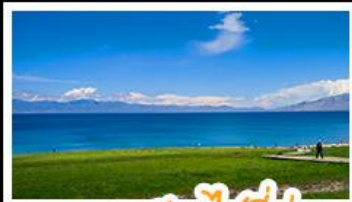
ทะเลสาบไซลีมู

หุบเขาดอกท้อ - ทะเลสาบไซลีมู แกรนด์แคนยอนตู่ซานจื่อ - ทุ่งหญ้านาลาตี