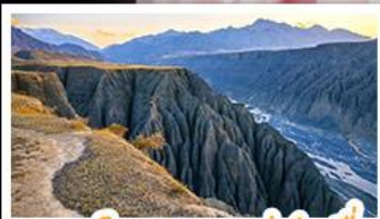
แกรนด์แคนยอนตู่ซานจื่อ