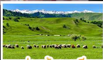
ทุ่งหญ้านาลาตี