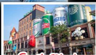
โรงเบียร์ชิงเต่า