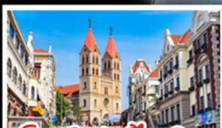
โบสถ์เซนต์ไมเคิล