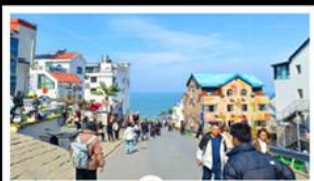
ถนนคอปเพิลิงหมายเลข 8

สัมผัสความยิ่งใหญ่ของ 4 เมืองสำคัญ ชิงเต่า - เยียนโก - เฟิงไห่ - เว่ยไห่ ปาต้ากวน - โบสถ์คาทอลิก - ตึกเก่าริมหา