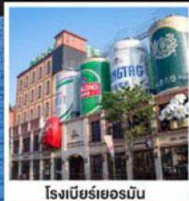
โรงเบียร์เยอรมัน