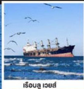
เรือลู เวย์ส์