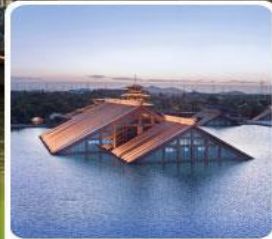
พิพิธภัณฑ์ไต้หน้ำ กวงฟู่หลิน