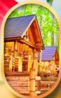
บึงเทิลเกอเรส