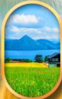
ทะเลสาบโทโยะ