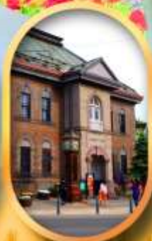
พิพิธภัณฑ์กล่องดนตรี