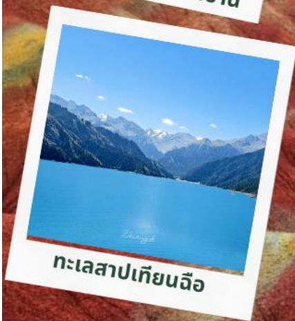
ทะเลสาปเทียนฉือ