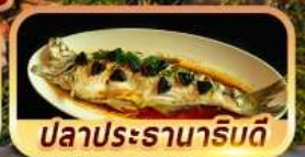
ปลาประรานาริมดี