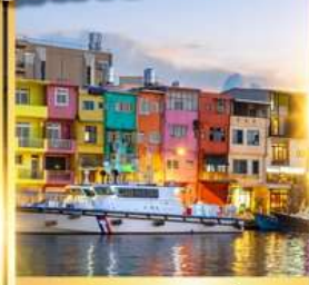
ท่าเรือประมงเจิ้งปิง