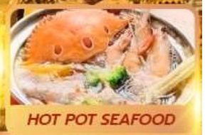
HOT POT SEAFOOD