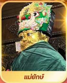
แม่ยักษ์