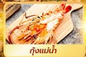
กุ้งแม่น้ำ