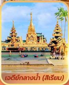
เจดีย์กลางน้ำ (สิริเยม)