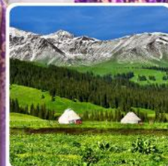
ทุ่งหญ้านาฬิกา