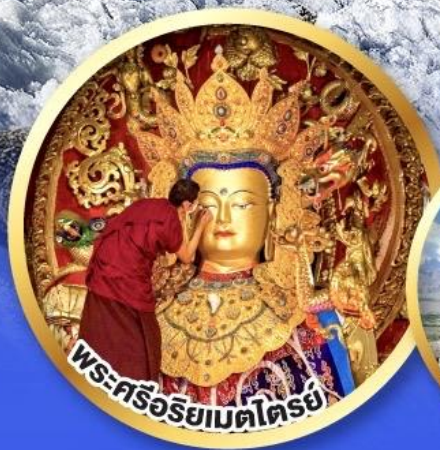
พระศรีอริยเมตไตรย์