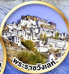
พระราชวังเลห์