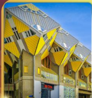
บ้านลูกเต่าโคกคูบัส

“ล่องเรือหลังคากระจก” ชมกรุงอัมสเตอร์ดัม