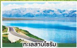
ทะเลสาบไซรัม