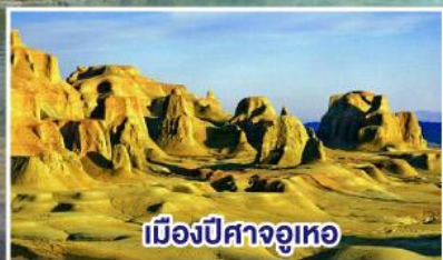
เมืองปีศาจจวูเทอ