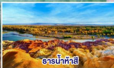
ธารน้ำห้าสี