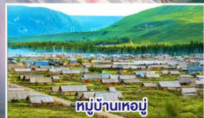
หมู่บ้านห่อมู่