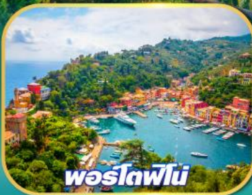
พอร์ตฟีโน