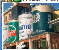
พรรกัณฑ์โรงเบียร์ชิงเต่า