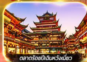
ตลาดร้อยปีเงินหวงเหมียว

เที่ยวดิสนีย์แลนด์เต็มวัน (รวมบัตร + รถรับส่ง) ช้อปปิ้งย่านดัง นานกิง, เงินหวงเหมียว