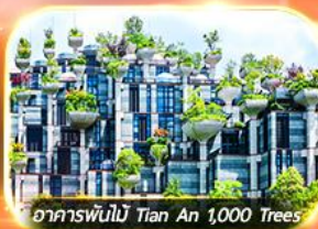
อาคารพันไม้ Tian An 1,000 Trees