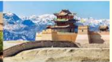
กำแพงเมืองจีน ด่านเจียหยวีกวน

*ทางบริษัทฯ ขอสงวนสิทธิ์ในการสลับโปรแกรมทัวร์ตามความเหมาะสมขึ้นอยู่กับสถานการณ์หน้างาน โดยคำนึงถึงผลประโยชน์ของลูกค้าเป็นสำคัญ