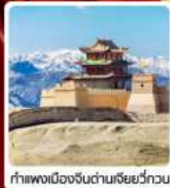
กำแพงเมืองจีนด่านเสี่ยววีกวน

• ไฮไลต์...เส้นทางสายไหม ชมสระบัววังพระจันทร์ ทะเลทรายหมีงาช้าง กำแพงเมืองจีนด่านสุดท้าย "เจียยวีกวน" มรดกโลกภูเขาสายรุ้งจางเย่