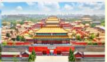
พระราชวังต้องห้ามปักกิ่ง

*ทางบริษัทฯ ขอสงวนสิทธิ์ในการสลับโปรแกรมทัวร์ตามความเหมาะสมขึ้นอยู่กับสถานการณ์หน้างาน โดยคำนึงถึงผลประโยชน์ของลูกค้าเป็นสำคัญ