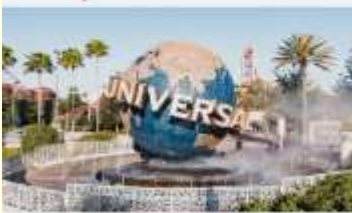
สวนสนุกยูนิเวอร์แซลปักกิ่งสตูดิโอ