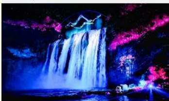
อุทยานน้ำตกหวงกั๋วซู่