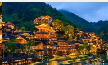
หมู่บ้านโบราณฉูเจียงจ้าย