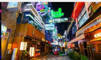
ถนนคนเดินซิงหยุน