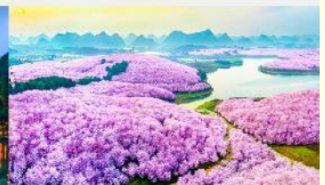
ชากรุง-ผิงป่า

*ทางบริษัทฯ ขอสงวนสิทธิ์ในการสลับโปรแกรมทัวร์ตามความเหมาะสมขึ้นอยู่กับสถานการณ์หน้างาน โดยคำนึงถึงผลประโยชน์ของลูกค้าเป็นสำคัญ