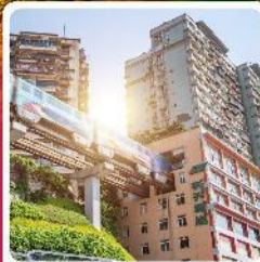
รถไฟฟ้าเกะลุตึก