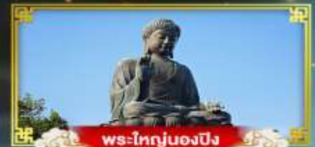
พระใหญ่ของปิง