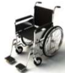
การรับการดูแลเป็นพิเศษ

กรณีผู้เดินทางต้องการความช่วยเหลือเป็นพิเศษ อาทิเช่น การใช้วีลแชร์ กรุณาแจ้งบริษัทฯ อย่างน้อย 7 วันก่อนการเดินทาง มิฉะนั้นบริษัทฯ จะไม่สามารถจัดการล่วงหน้าได้ เนื่องจากการขอใช้วีลแชร์ในสนามบินนั้น ต้องมีขั้นตอนในการขอล่วงหน้า และบางสายการบินอาจมีการเรียกเก็บค่าใช้จ่ายทั้งทางสนามบินในไทยและในต่างประเทศ ซึ่งผู้เดินทางสามารถสอบถามกับเจ้าหน้าที่ได้โดยตรงก่อนทำการจอง และหากในขณะของท่านมีผู้ต้องการดูแลพิเศษ เช่น ผู้ที่นั่งรถเข็น (Wheelchair), เด็ก, ผู้สูงอายุและผู้ที่มีโรคประจำตัวหรือไม่สะดวกในการเดินทางท่องเที่ยวในระยะเวลาเกินกว่า 4 - 5 ชั่วโมงติดต่อกัน ท่านและครอบครัวต้องให้การดูแลสมาชิกภายในครอบครัวของท่านเอง เนื่องจากการเดินทางเป็นหมู่คณะ หัวหน้าทัวร์มีความจำเป็นต้องดูแลคณะทัวร์ทั้งหมด