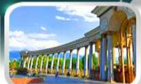
1st President Park