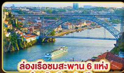
ล่องเรือชมสะพาน 6 แห่ง ในคูโรเมืองปอร์โต