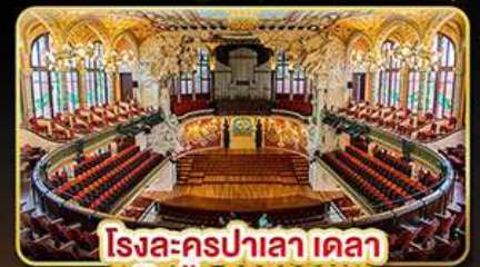
โรงละครปาเลา เดลา มุสิก้า คาคาลานา