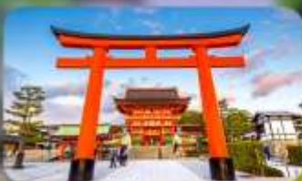
ศาลเจ้าฟูชิมิ