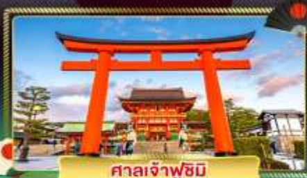
ศาลเจ้าฟูชิมิ