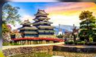
ปราสาทมิดสึโมโด้