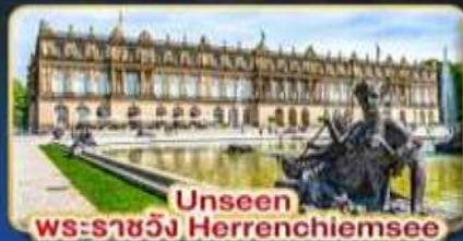
Unseen พระราชวัง Herrenchiemsee

บรรยากาศแสนโรแมนติก เส้นทางแห่งความฝัน พิชิต 2 ยอดเขา 2 ประเทศ TITLIS • ZUGSPITZE