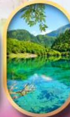
จิ่วจ้ายโกว