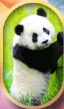
ศูนย์อนุรักษ์หนีแพนด้า