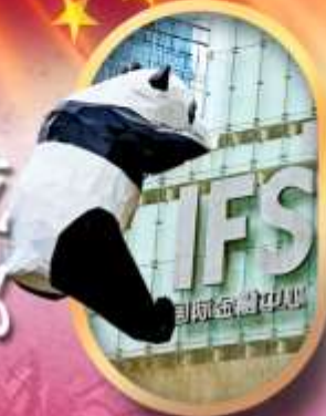
IFS หนีแพนด้าป็นตึก