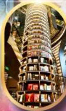
หอหนังสือจางชู่เก๋