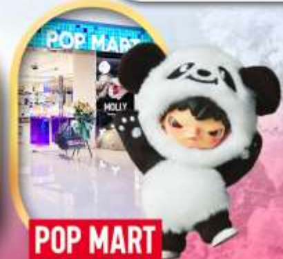
ช้อปปิ้งร้าน Pop Mart