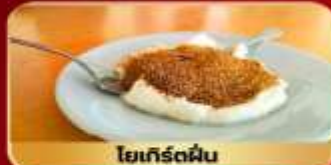
โยเกิร์ตผืน