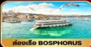
ล่องเรือ BOSPHORUS