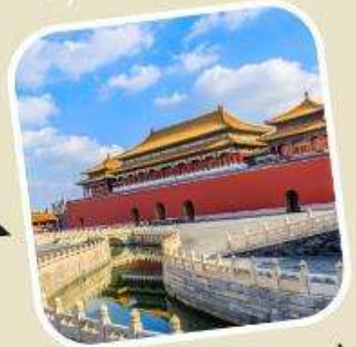
3 พระราชวังต้องห้าม