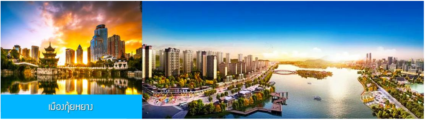
เมืองกู่หยาง