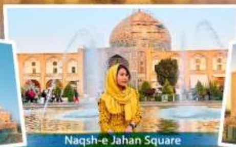
Naqsh-e Jahan Square