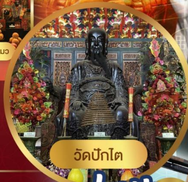
วัดปักโต