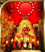
วัดเจ้าแม่กวนอิม ฮ่องซา