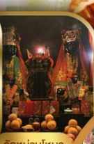
วัดบ้านใหม่