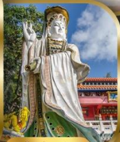
เจ้าแม่กวนอิม ริพลัสเบย์