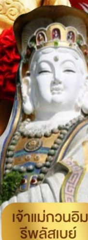
เจ้าแม่กวนอิม ริพลัสเบย์