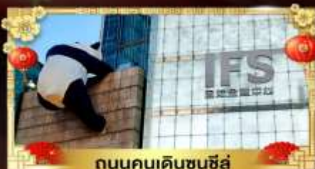
ถนนคนเดินชุนซีอู๋

เที่ยวอุทยานสวรรค์ระดับ 5A จิวจ้ายโกว "ภูเขาเสีดรุณี" อุทยานชื่อดังเหนียงซาน