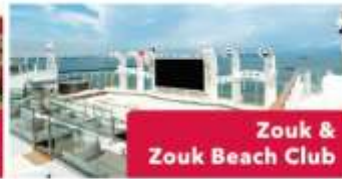
Zouk & Zouk Beach Club