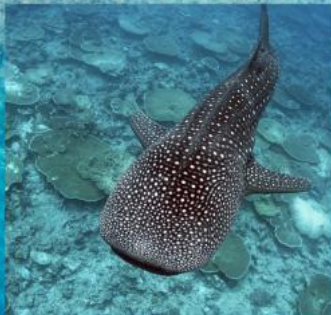
Whale Shark Snorkeling