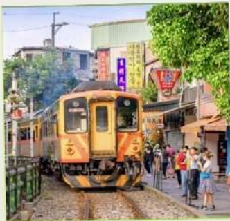
สถานีรถไฟสีเฟิน